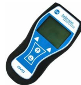
S&DL mini ハンディターミナル 本体 ×1台