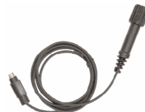
ダイレクト OP 接続ケーブル ×1本