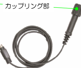
ダイレクト OP 接続ケーブル ×1本