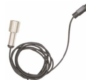
ダイレクト RD ケーブル ×1本