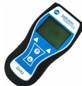
S&DL mini ハンディターミナル 本体 ×1台