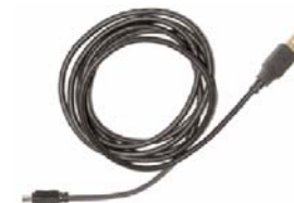
USB 接続ケーブル ×1本